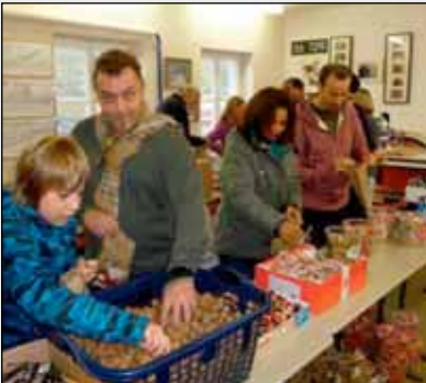
Hier unser Packtag für die 650 Nikolaussäckchen.

Dann erst zum Nikolauswochenende rollten wieder die Wagen. Doch vorher gilt es alles vorzubereiten. Allein die Päckchen packen, Züge zu schmücken, Bahnhof Oppingen vorbereiten und schauen, dass die Kostüme noch in Ordnung sind, verbraucht viel Zeit. Nebenher wurde plötzlich unser Zuweg zum Bahnsteig drei Tage vor den Nikolausfahrten auf Grund von Breitbandkabelverlegungsarbeiten aufgebaggert. Wir waren abgeschnitten. Zusätzlich war die ausgehobene Erdmasse im Lichtraumprofil der Trasse abgeladen worden. Erst durch viele Telefonate konnte erwirkt werden, dass einen Tag vor unserem Fahrtag das ganze wieder zugeschüttet und begehbar gemacht wurde.